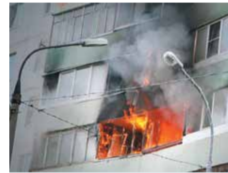
Информация 4 РОНД Управления по ЮЗАО ГУ МЧС России по г. Москве Москва

Порядок вызова пожарных и спасателей с телефонов операторов стационарной и сотовой связи: 101