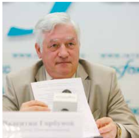
Председатель Мосгоризбиркома Валентин Горбунов

Агитационный период, согласно календарному плану, начинается со дня выдвижения кандидата и заканчивается в 00.00 часов 13 сентября. Предвыборная агитация на телеканалах и в периодических печатных СМИ разрешена с 16 августа до 00:00 13 сентября.